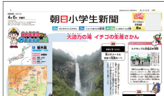
毎日発行、月ぎめ2,100円(税込み) 購読のお申し込みはお近くのASAへ、お孫さんへ新聞を贈る「朝学ギフト」も受付中。

「都道府県」は、小学校の社会科で必ず学び、中学入試でも頻出項目です。朝日小学生新聞を楽しく読んで、地理博士になってくださいね。